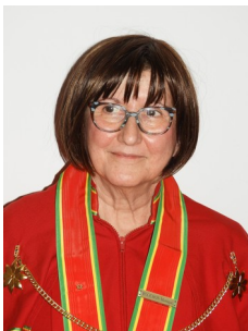
Monique ROUCHON Maître des Sceaux