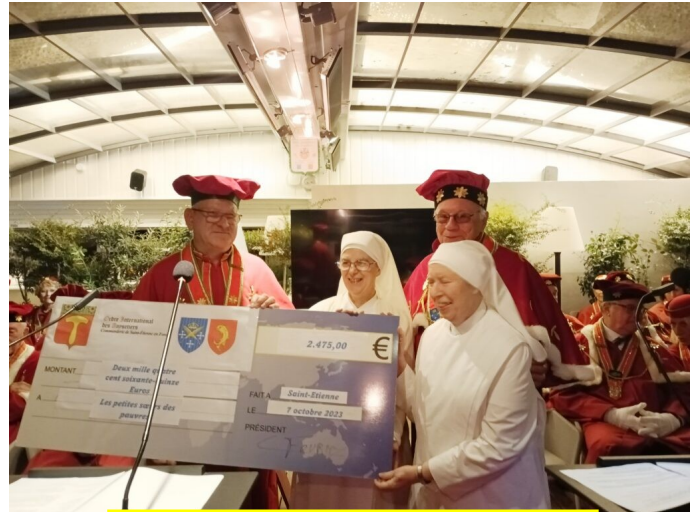
2023 : Les Petites sœurs des pauvres