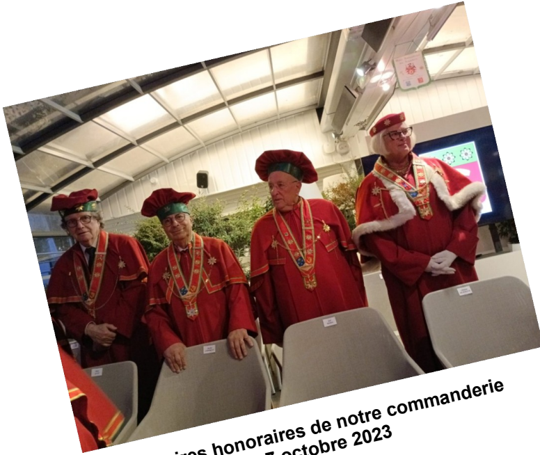
Dignitaires honoraires de notre commanderie Le 7 octobre 2023