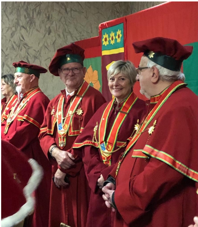
Chapitre Magistral de Franche-Comté le 18 novembre 2023