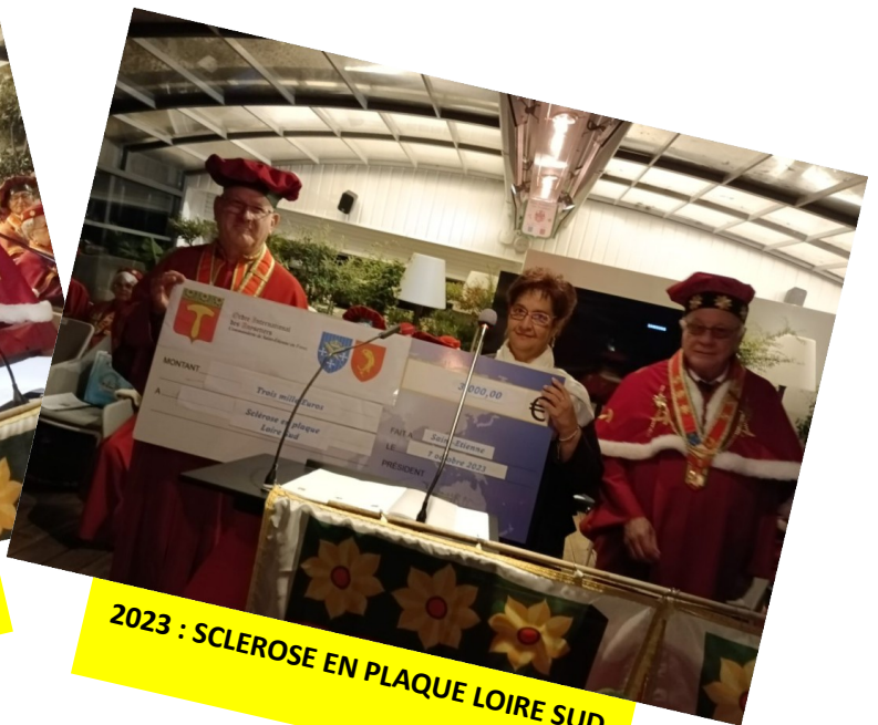
2023 : SCLEROSE EN PLAQUE LOIRE SUD