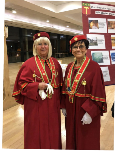
Chapitre Magistral Indre en Berry le 25 novembre 2023