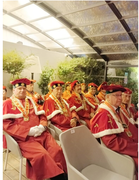
Dignitaires des Commanderies amies, le 7 octobre 2023