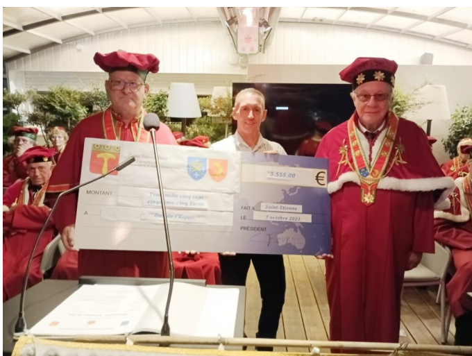
2023 : EURECAH