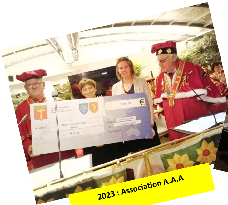
2023 : Association A.A.A